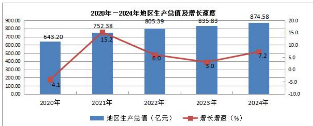
表 1：2020-2024 年枣阳市地区生产总值及增长速度

初步核算，2024 年全市地区生产总值（GDP）874.58 亿元，按不变价格计算，比上年增长 7.2%。分产业看，第一产业增加值 126.42 亿元，增长 2.9%；第二产业增加值 308.87 亿元，增长 10.4%；第三产业增加值 439.29 亿元，增长 6.1%。三次产业结构为 14.5:35.3:50.2。全年人均地区生产总值 98340 元，按不变价格计算，比上年增长 4.6%。