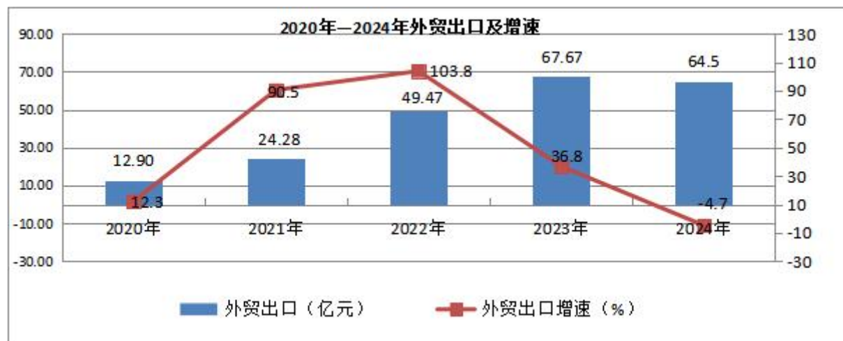
表 5：近五年外贸出口及增长速度

全市完成出口总额 64.5 亿元，比上年下降 4.7%。实际利用外资 675.0 万美元，下降 0.04%。