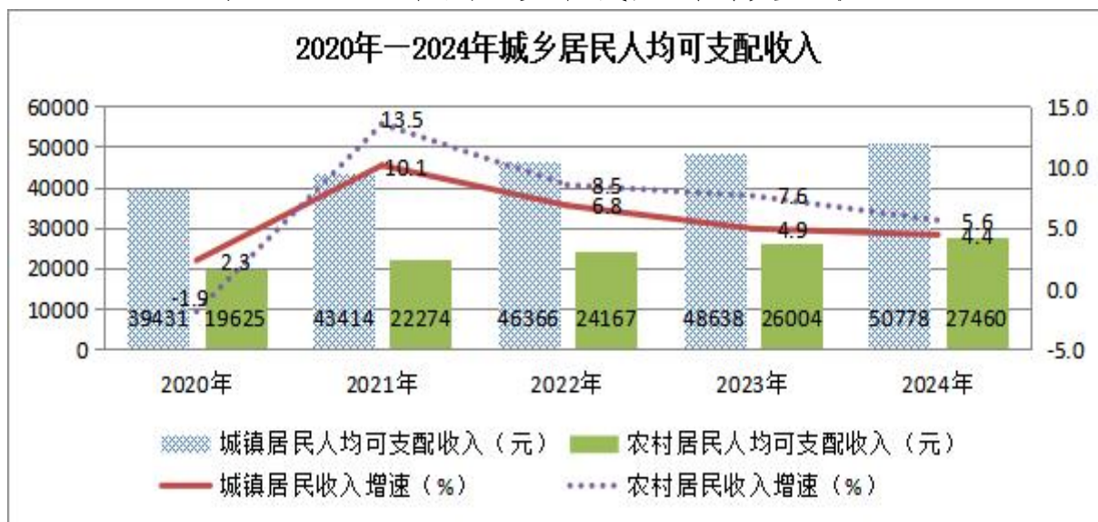
表 7：近五年城、乡居民人均可支配收入

年末全市参加基本养老保险参保人数 67.28 万人，其中，城乡居民基本养老保险人数 53.30 万人。基本医疗保险参保人数达 86.62 万人，其中，城乡居民医疗保险参保人数 80.16 万人。失业保险参保人数 3.99 万人，比上年增长 7.4%，全年登记失业率为 1.95%。全市居民最低生活保障已保人数 1.46 万人，其中农村居民最低生活保障人数 1.32 万人。共有提供住宿的民政服务机构 42 个，床位 6207 张。