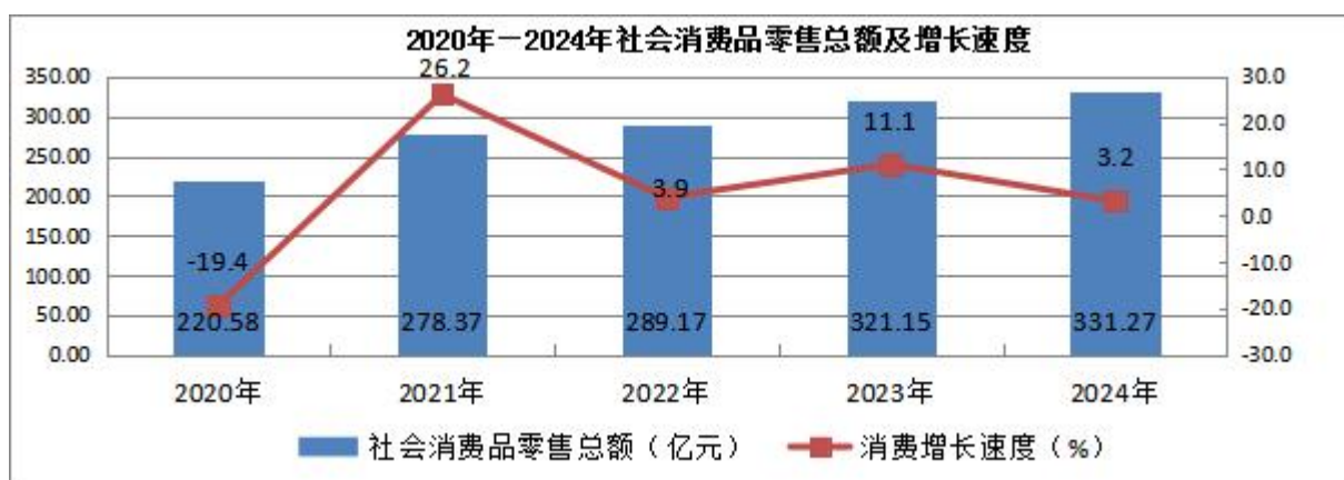
表 4：2020 年-2024 年社会消费品零售总额及增长速度

全市社会消费品零售总额 331.27 亿元，比上年增长 3.2%。按经营地统计，城镇消费品零售额达 285.19 亿元，与上年持平；乡村消费品零售额达 46.08 亿元，增长 18.2%。分行业看，批发零售业消费品零售额 298.43 亿元，增长 1.9%；住宿餐饮业消费品总额 32.84 亿元，增长 15.7%。